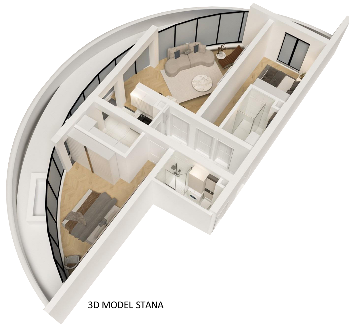
3D MODEL STANA